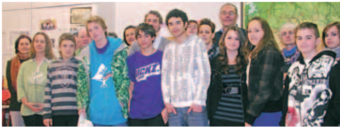
Schüler und Paten beim Treffen für den dritten IOB-Auftakt

Eine, das hat sich in den zurückliegenden beiden Jahren der Initiative gezeigt, für die hochengagierten Gemeindebürger unseres Schulspengels herausfordernde Aufgabe. Nicht alle am IOB-Projekt teilnehmenden Schüler sind sofort in der Lage, die ihnen angebotenen Hilfen im Alltag zu nutzen. Enttäuschungen blieben nicht aus. Insgesamt gesehen jedoch – darin sind sich alle Beteiligten einig – ist IOB erfolgreich. Die im Beruf stehenden Mentoren begleiten die freiwillig am Projekt teilnehmenden Schüler bei der Suche nach einem passenden Ausbildungsberuf, helfen beim Finden von Praktikumsstellen sowie beim Abfassen von Bewerbungsschreiben und vermitteln den Jugendlichen Kulturtechniken, die einen erfolgreichen Auftritt bei einem Vorstellungsgespräch ermöglichen. Wir hoffen, dass auch die dritte Runde zufriedenstellende Ergebnisse zeitigt und die beteiligten Schüler einen guten Start ins Berufsleben hinlegen.