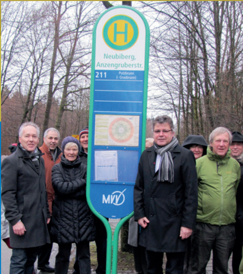
Zwei Streifen – statt vier Streifen ...

Ausstellung im Rathaus vom 24.2. – 21.3.2014