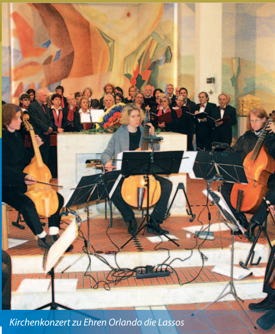
Kirchenkonzert zu Ehren Orlando die Lassos