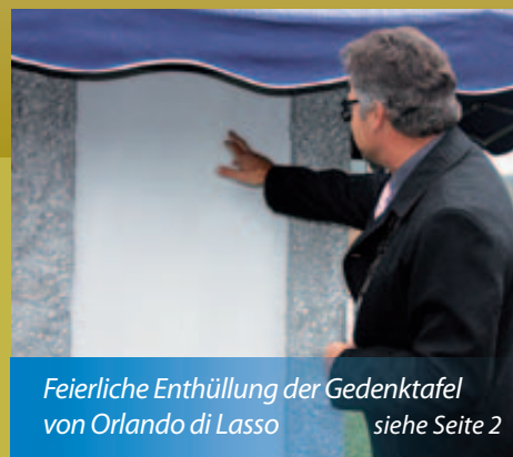
Feierliche Enthüllung der Gedenktafel von Orlando di Lasso siehe Seite 2