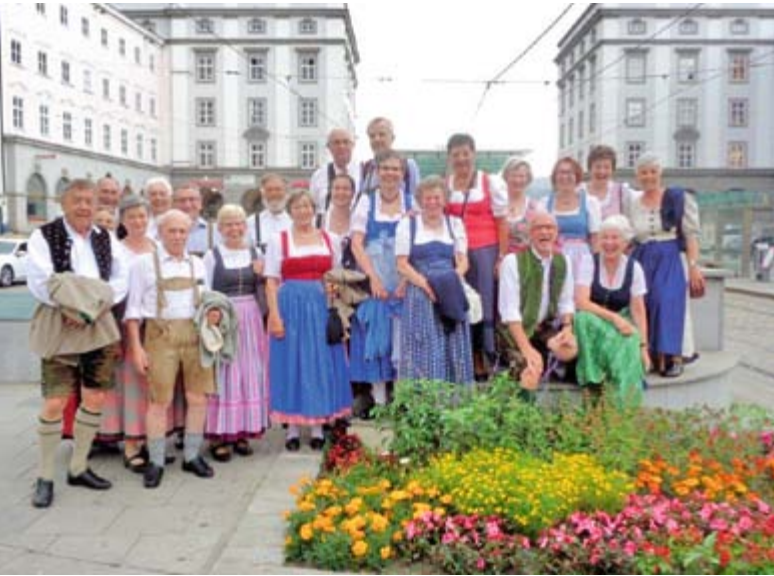
Der Volkstanzverein bei seinem Ausflug nach Linz